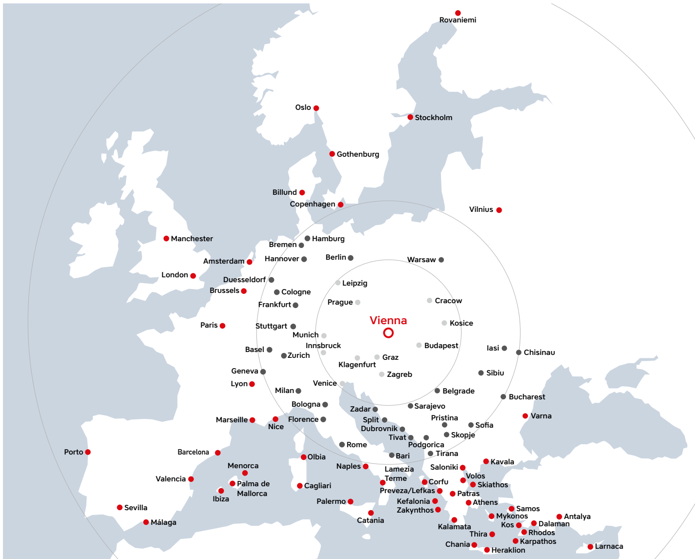
Einige Destinationen werden ausschließlich saisonal angefliegen. Certain destinations are only operated on a seasonal basis.